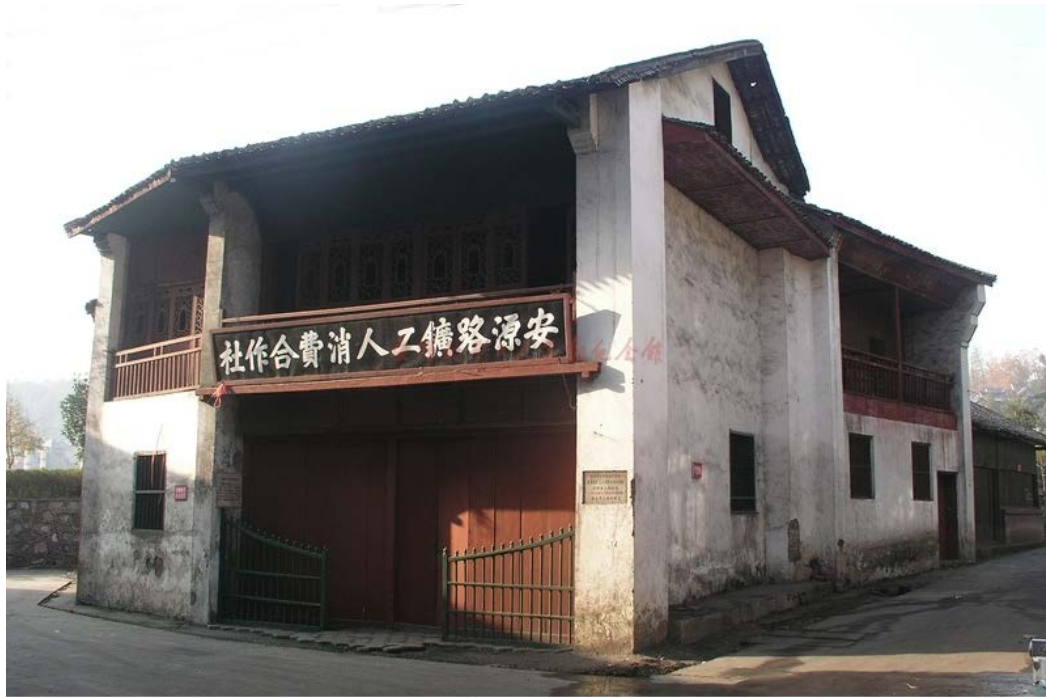
安源路矿工人消费合作社旧址

俱乐部因为领导工人罢工斗争取得重大胜利，早已深入人心。工友们尽管家庭生活困难，但依然踊跃认购股票，很快筹集到 7800 多元股金，连同俱乐部划拨的 1 万元活动经费，共计 1.8 万多元。消费合作社还自行设计了购股凭证，发给每位认购的工友。